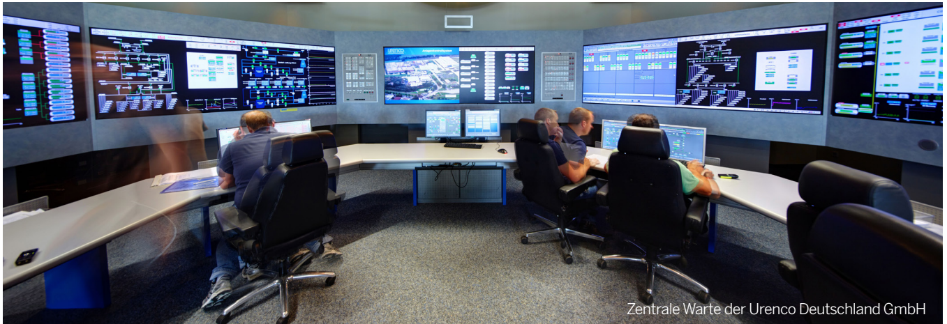
Zentrale Warte der Urenco Deutschland GmbH