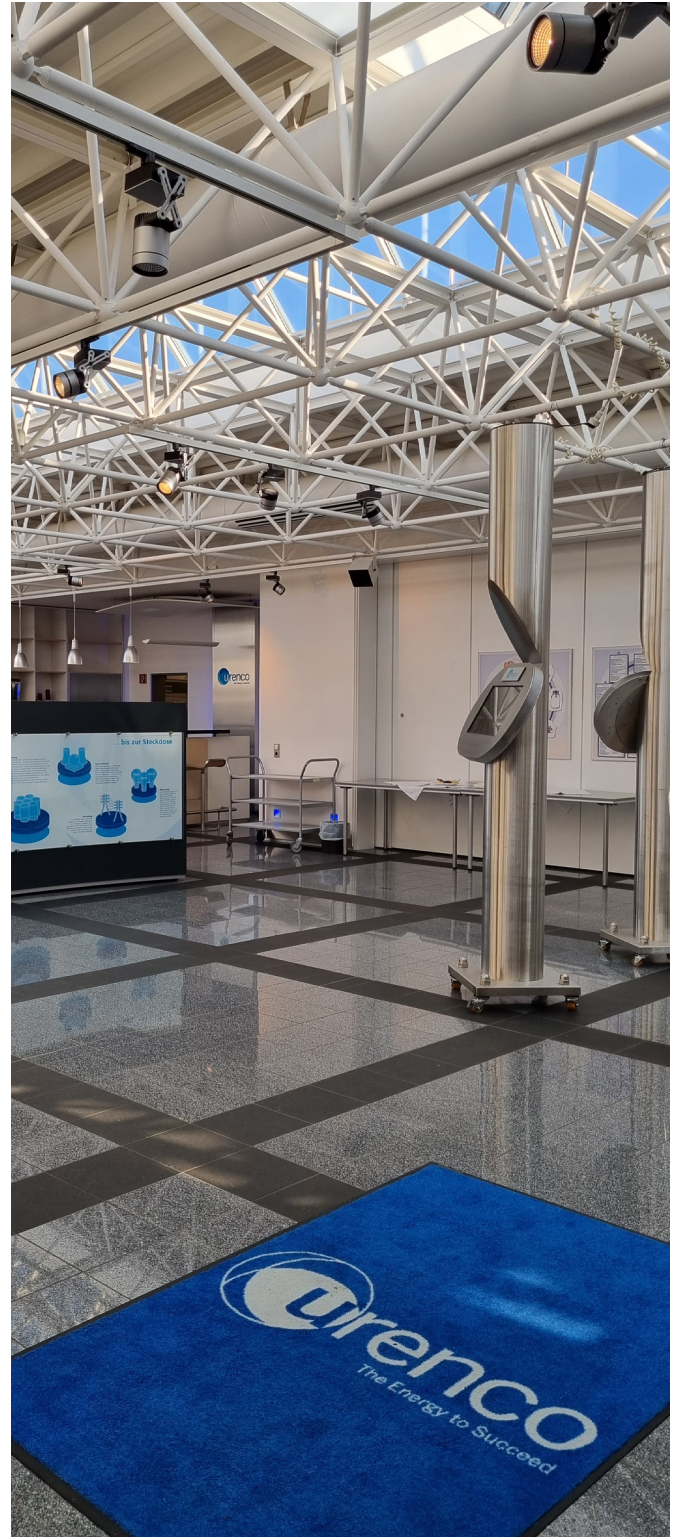
Informationszentrum der Urenco Deutschland GmbH

8. Ausgabe: April 2023 Herausgeber: Urenco Deutschland GmbH Röntgenstraße 4 48599 Gronau